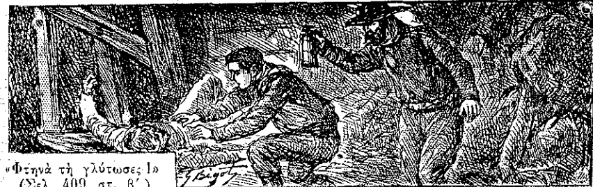
«Φτίνῃ τὴ γλύτωσε!» (Σελ. 409, στ. β')

— Πέστε μου, θεῖτε μου, ἐρώτησε ὁ Στέφανος μὲ φωνὴν, ποῦ προσπαθοῦσε νὰ τὴν κάμῃ σταθερὴν, ποῦ ἐργάζεται σήμερον εἰς τέσσαρα κλαδιά, διὰ νὰ νομίσῃ ἡ ἀγγελία-μητέρα ὅτι τὸ παιδί της ζῇ ἀκόμην καὶ νὰ ἐξακολουθῇ νὰ κάμῃ πάντοτε τὸ ἴδιον γάλα.