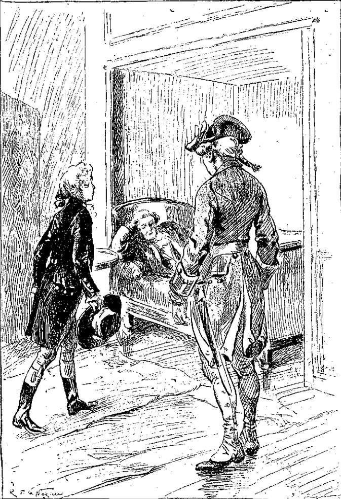
«Ὁ στρατιώτης ἤνοιξε μιαν θύραν καὶ ὁ Μπόμπης εὐρέθη εἰς μιαν αἰθουσαν ἐπιπλωμένην πολυτελῶς...»

Ἡ ὑποδοχὴ αὐτῆ, τόσον διαφορετικὴ ἀπὸ ἐκείνας ποὺ τοῦ ἔκαμναν εἰς τὰ ξενοδο- χεῖα τῶν μικρῶν πόλεων καὶ τῶν χωριῶν, κατὰ τὸ διάστη- μα τοῦ ταξιδίου του, ἀφῆρσεν ἀπὸ τὸν μικρὸν τζοκεῖ μὲγα μέρος τοῦ θάρρους του. Συνεσταλμένος, διέσχισε τὰς