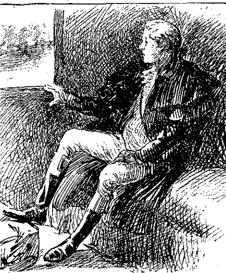
«Κάθε στιγμήν ἔψαυε μὲ τὸ πόδι του τὸν σάκκον...»

— Λοιπόν, κύριε; τὸν ἠρώτησε χαμηλοφώνως εἰσθε εὐχαριστημένος; ἡ πληροφορία ποῦ σᾶς ἔδωσα, γιὰ τὸ γράμμα καὶ τὰ λοιπά, σᾶς ἐχρησίμευσαν;